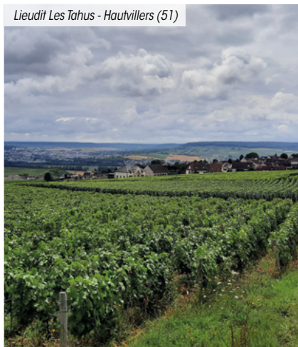
Lieudit Les Taus - Hautvillers (51)

(3) Pour les non résidents, seuls les immeubles détenus en France sont pris en compte.